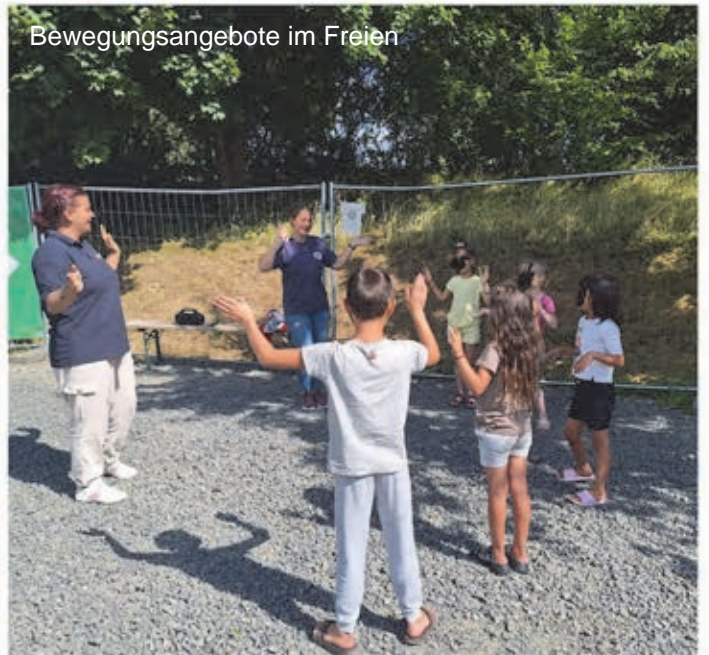
Bewegungsangebote im Freien