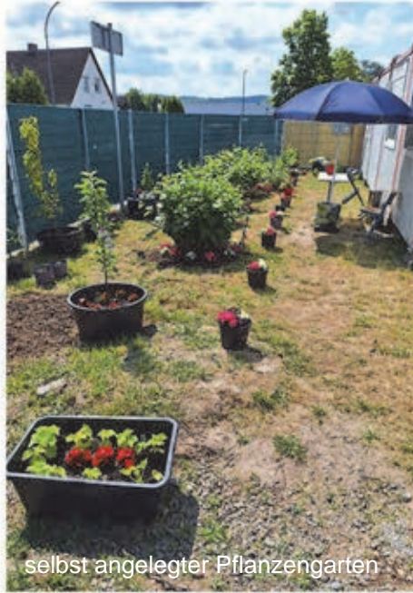
selbst angelegter Pflanzgarten