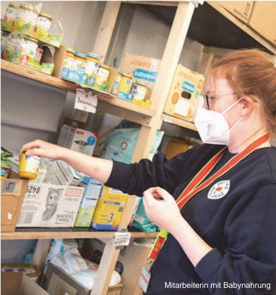
Mitarbeiterin mit Babynahrung