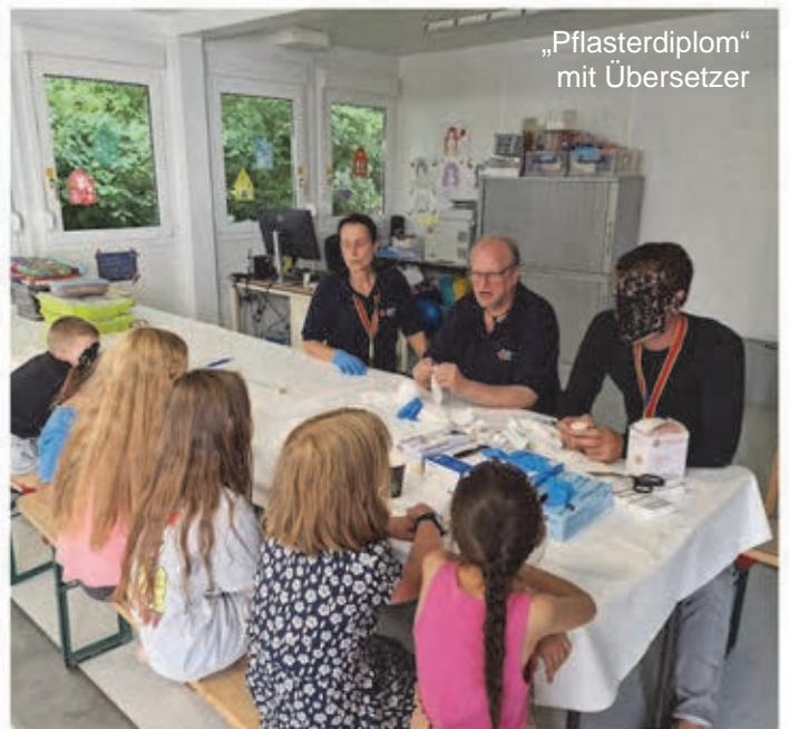
„Pflasterdiplom“ mit Übersetzer