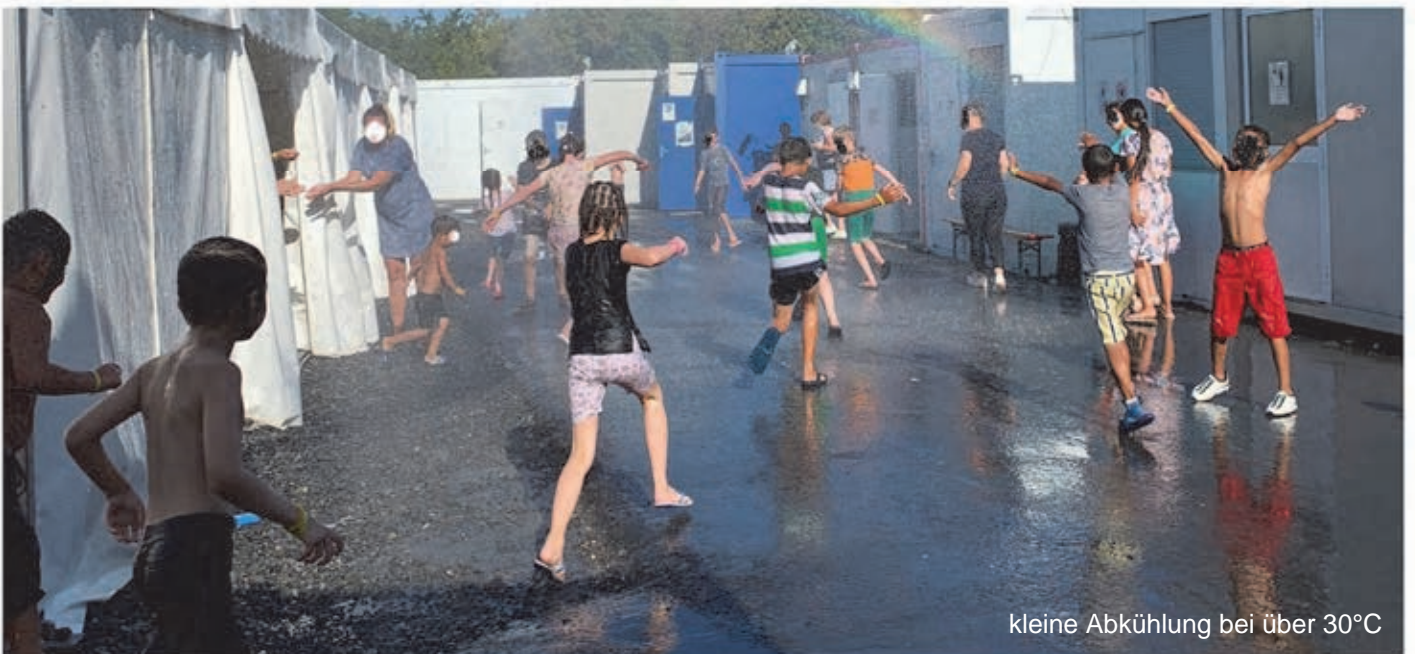
kleine Abkühlung bei über 30°C