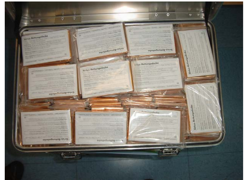
obere Lage ↑