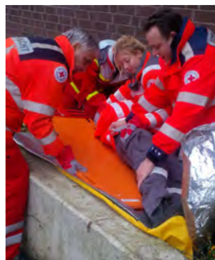
Sanitäts-Ausbilder-Lehrgang profitiert von neuem methodisch-didaktischen Konzept