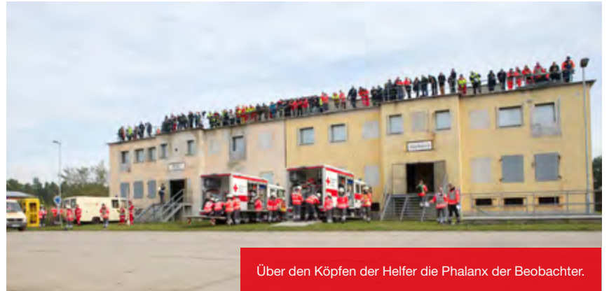
Über den Köpfen der Helfer die Phalanx der Beobachter.

Hessische Katastrophenschutzeinheit bei Vollübung in Brandenburg