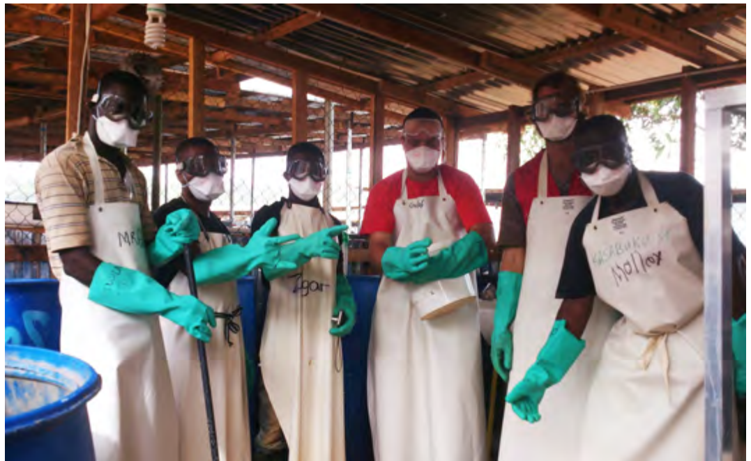
Ausrüstung ist ebenfalls beim Aufbereiten von Wasser notwendig, da mit Chlor hantiert wird.