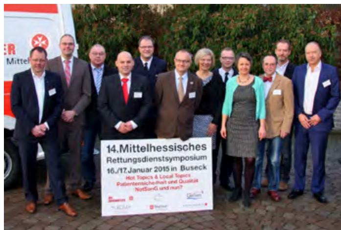
Sehr praxisorientiert und Raum für Austausch: Die Fachleute des Qualitätszirkels Notfallmedizin freuten sich erneut über ein sehr erfolgreiches Rettungsdienstsymposium in Buseck.

Die Verlegung eines Patienten mit dem Intensivtransporthubschrauber und die Versorgung eines Patienten im Simulationsrettungswagen, was als Teamtrainingsübung angelegt war. Über 500 Teilnehmerinnen und -nehmer aus den Landkreisen Gießen sowie Mar-