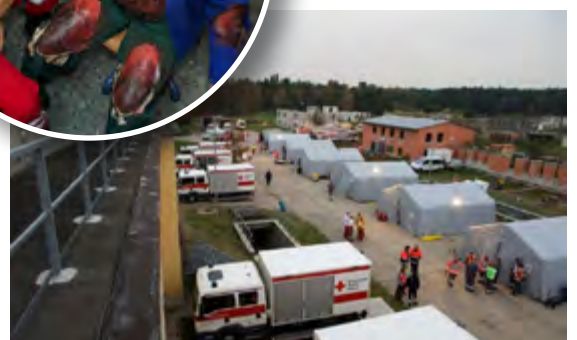
Unten: Der Behandlungsplatz im Überblick.