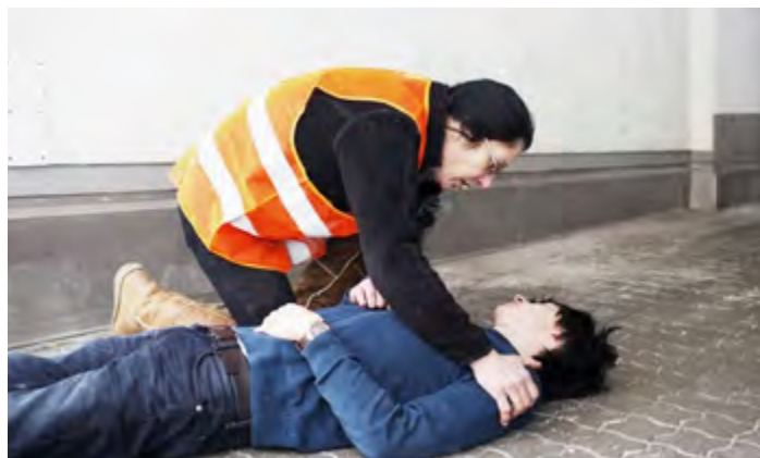
Erste Hilfe- Kurse dauern künftig nur noch neun Unterrichtseinheiten. Neue didaktische Methoden machen es möglich.