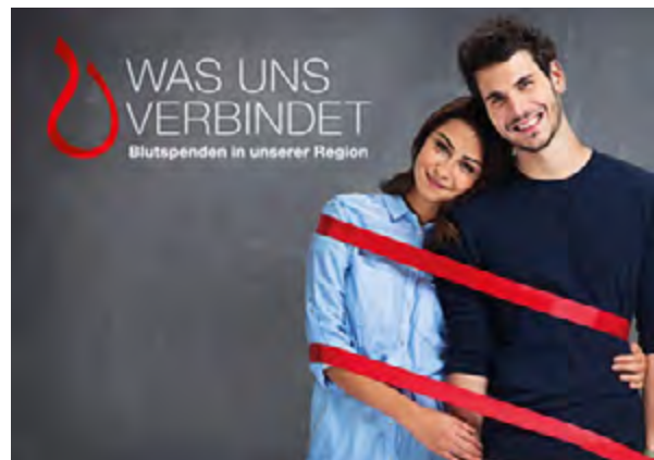
Ein rotes Band, das Menschen miteinander verbindet. Die neue Aktion der DRK-Blutspendedienste findet schon viele kreative Zustimmungen. Nachahmung erwünscht!

schen dem DRK-Blutspendedienst, den Spendern, den Empfängern und der Region sichtbar: mit einem roten Band. Nähere Infos unter www.blutspenden-verbindet.de/