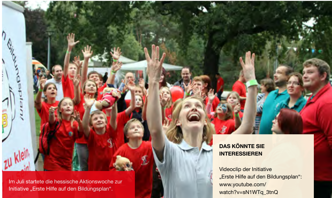
Im Juli startete die hessische Aktionswoche zur Initiative „Erste Hilfe auf den Bildungsplan“.

Unter dem Motto „Keiner ist zu klein, um ein Helfer zu sein!“ geht