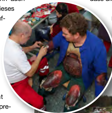
Links: Realistischer ging nicht mehr: Mime mit simuliertem Brandverletzungsmuster.